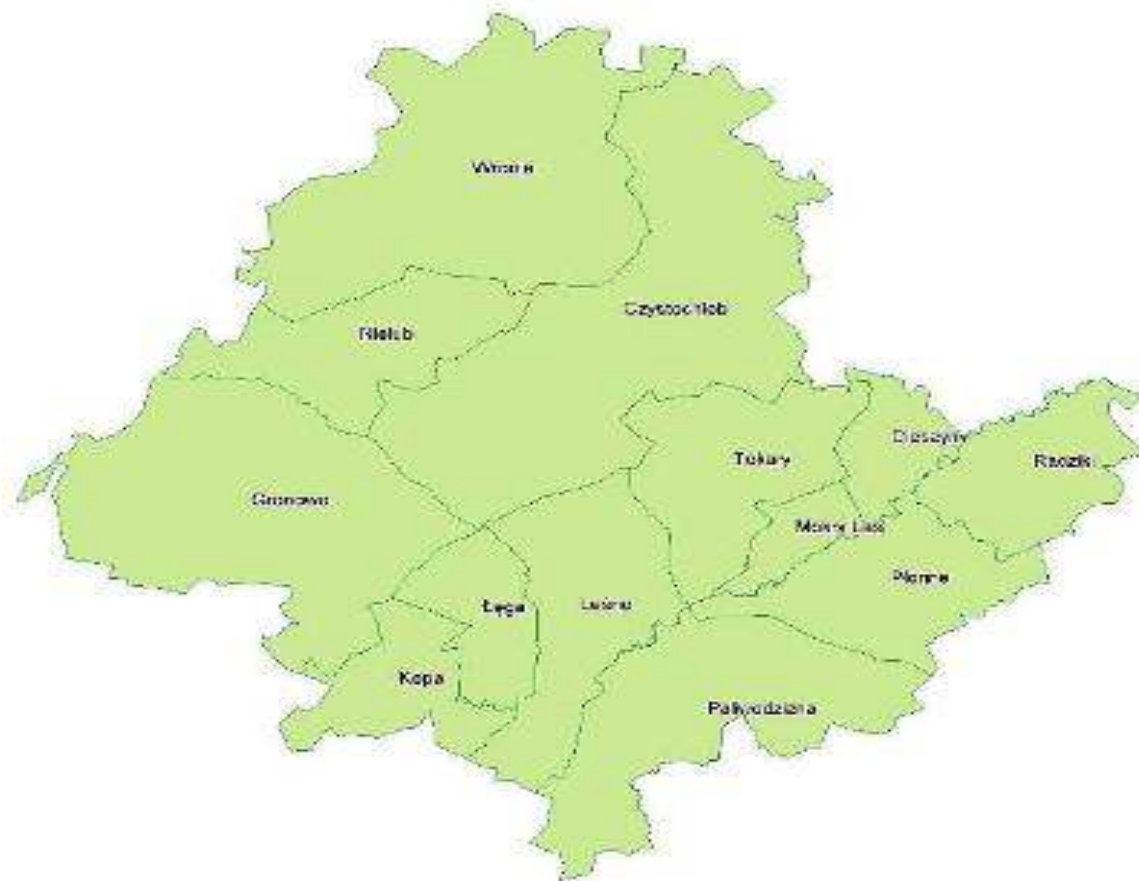
Mapka nr 2: Podział terytorialny Nadleśnictwa Golub-Dobrzyń